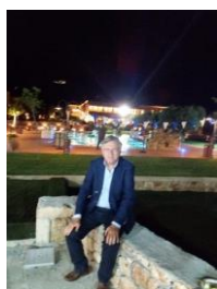
Ο Πρόεδρος του Σ.Α.Κ. στα εγκαίνια

Ακολούθησε δεξίωση στους κήπους και στην πισίνα του ξενοδοχείου όπου οι προσκεκλημένοι είχαν την δυνατότητα να γνωρίσουν από κοντά τους χώρους του, που εκτός των καταπληκτικών δωματίων, περιλαμβάνει δυο εστιατόρια, αίθουσα δεξιώσεων, wine bar, τέσσερα γήπεδα τένις, δύο πισίνες, spa, καφετέρια, καταστήματα με τοπικά προϊόντα και χώρο κομμωτηρίου . Σημειώνεται ότι το Mystras Grand Palace Resort & Spa είναι το πρώτο ξενοδοχείο 5 αστέρων στη Λακωνία.