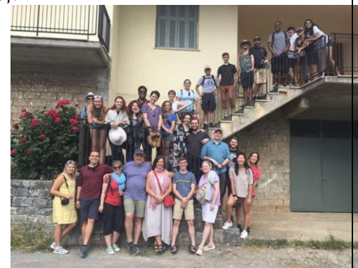
στην οικία Σταθάκη

Τελικά όπως όλοι μας που δεν ζούμε στο χωριό - κανένας δεν θέλει να φύγει όταν ο ήλιος δύσει και πρέπει να συνεχίσουμε το ταξίδι μας. Όταν το ταξίδι τελειώνει τους ρωτάω ποιο ήταν το αγαπημένο τους κομμάτι από το ταξίδι τους στην Ελλάδα - οι περισσότεροι φοιτητές δεν διστάζουν να πουν « ΤΟ ΧΩΡΙΟ! »!