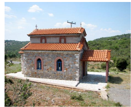
Ο Ι.Ν. Αγίων Ταξιάρχων

Ενημερωτικό Δελτίο του Συνδέσμου των Απανταχού Καρυατών